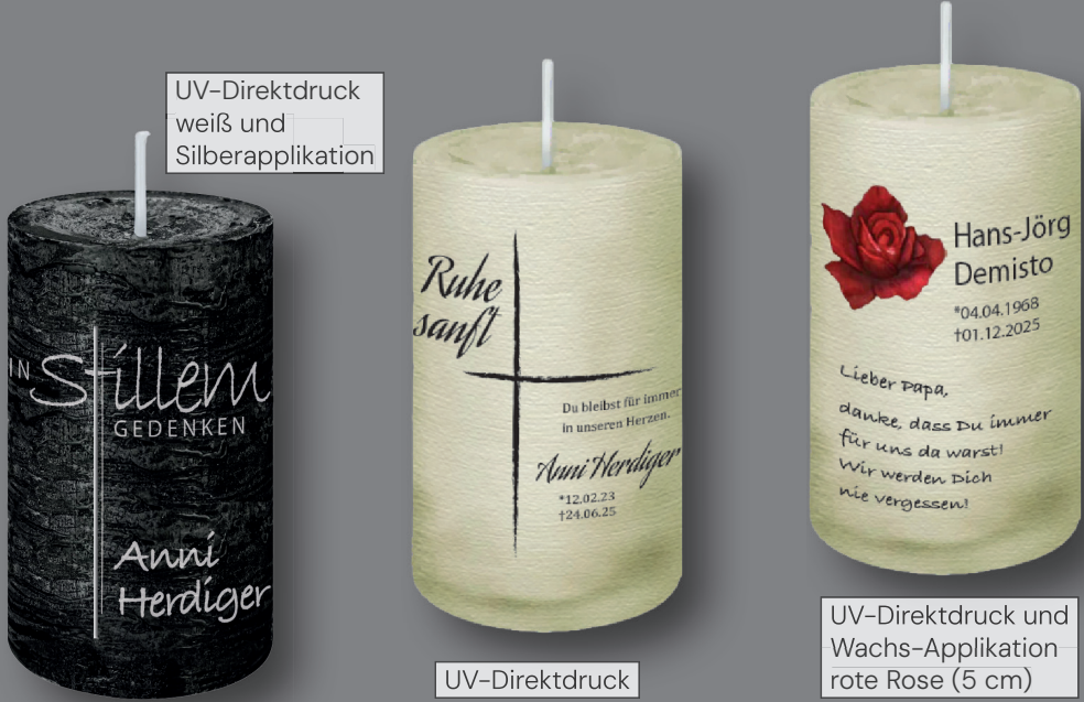
UV-Direktdruck weiß und Silberapplikation

Die hohe Qualität und das rustikale Design der Marble Serie der Firma Wiedemann machen diese durchgefärbten Kerzen besonders. Klassische Farben und die marmorierte Oberflächenstruktur unterstreichen die Natürlichkeit dieser Kerzen.