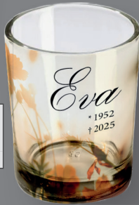
Glas für Teelichter 65 x 55 mm (4 Std.) UV-Direktdruck auf Glas