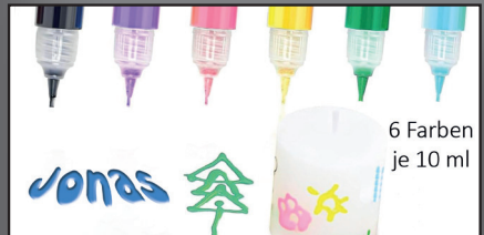
6 Farben je 10 ml