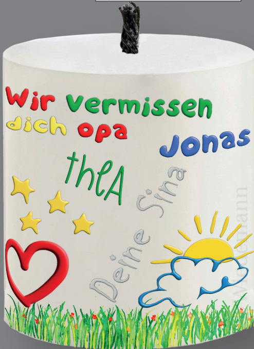
Outdoor-Kerze 200 x 170 mm (120 Std.) zum Selbstgestalten