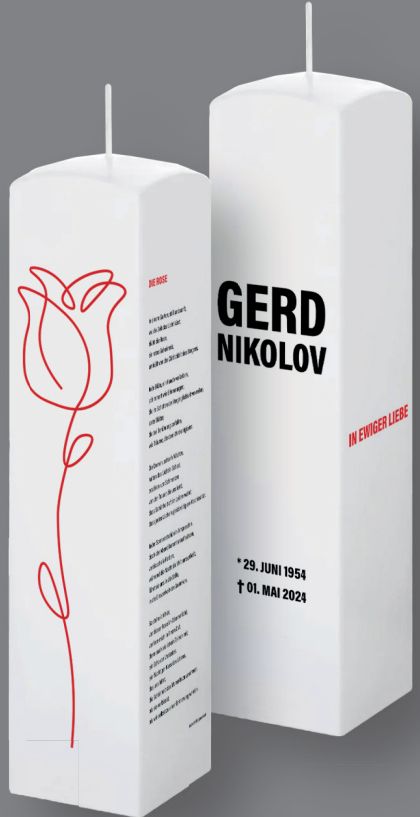
Vierkant-Kerze weiß 250 x 60 mm (70 Std.) UV-Direktdruck auf allen Seiten