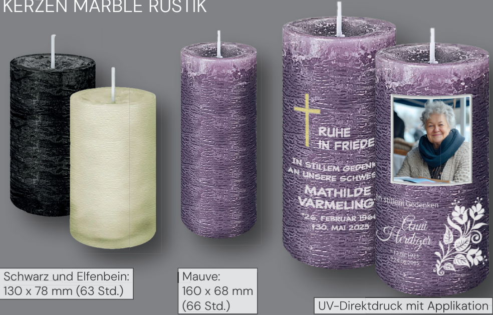
Schwarz und Elfenbein: 130 x 78 mm (63 Std.)