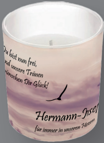
Kerze im Glas 81 x 73 mm (30 Std.) UV-Direktdruck auf Glas