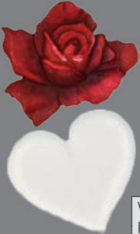
Wachs-Applikation Rose, weißes Herz, Kreuz