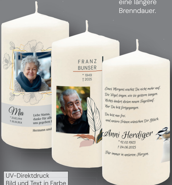
UV-Direktdruck Bild und Text in Farbe